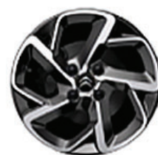
SAN DIEGO Hliníkové disky 16"