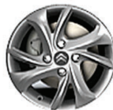
TUORLA Hliníkové disky 15"