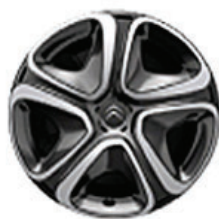
3D Okrasný kryt 16"