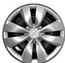
ASTERODEA Okrasný kryt 15"