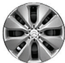
WHALETAIL Okrasný kryt 15"